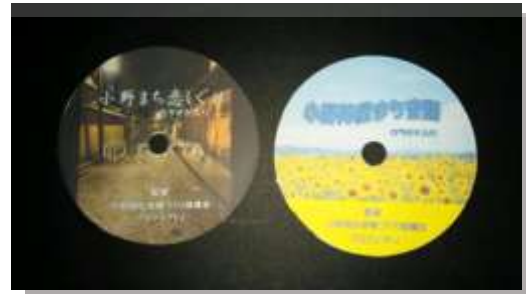
小野まち恋しぐれ(左)と小野陣屋まち音頭(右) CD写真はイメージです